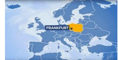
Deutschland im brasilianischen Fernsehen

Die nächste ☺ LaMa-Ausgabe erscheint am ☺ Freitag, 8. Januar 2021 ☺