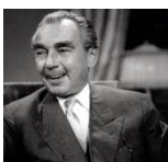
Erich Kästner, Die Weltbühne, 1930